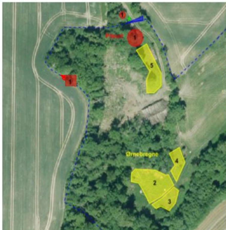
Kendte bevoksninger med pileurt og ørnebregne

Arbejdsgruppen kan fjerne dette for at lette rydningen.