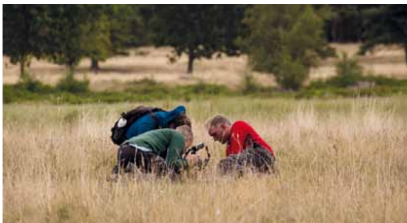
Småt er godt. Her undersøges en kokasse for spændende biller.