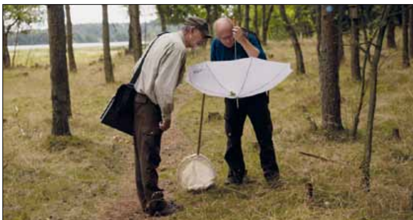
En omvendt paraply under en gren, et par hurtige ryst og vupti – 10 nye arter som skal bestemmes!

Fugleværnsfonden har tidligere også holdt BioBlitz i Vaserne og på Hyllekrog også her med mange nye og sjældne fund.