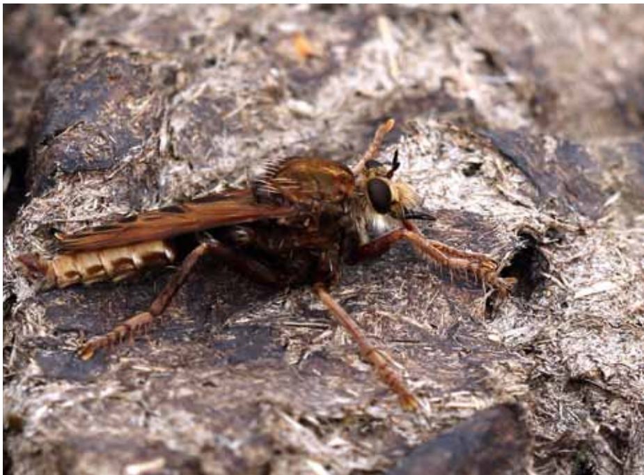
Den sjældne stor gødningsflue venter på bytte.

En anden årsag til nedgangen skyldes, at konventionelle køer behandles med ormemedler, og de gør kokasserne totalt uspiselige og direkte giftige for insekter. Desuden bliver de fleste kreaturer først sluppet løs i naturen i maj efter en lang vinter i stalden. Det er alt for sent for mange møgbiller, som kommer frem allerede i april og har hårdt brug for mad i form af gødning.