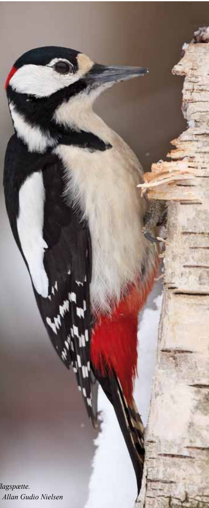
Stor flagspætte.

- om testamente og arv til Fugleværnsfonden