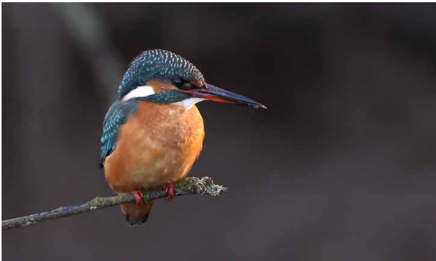
Hunnen hos isfuglen har rød basis af undernæb, hvorimod hannens næb er helt sort.

I år kan de ofte opleves på ganske nært hold fra isfugle-skjulet ved kanten af Ravnstrup Sø. I øvrigt kan den farvestrålende fugl ikke kun opleves ved de ferske vande. Især forår og efterår kan man i havneområder og i fjordbugter være heldig at se den. Et andet rigtig godt sted er fra Fugleværnsfondens tårn ved Nivå Bugt Strandenge. Her kan man ofte opleve isfuglen søge føde i det lave vand nær tangen.