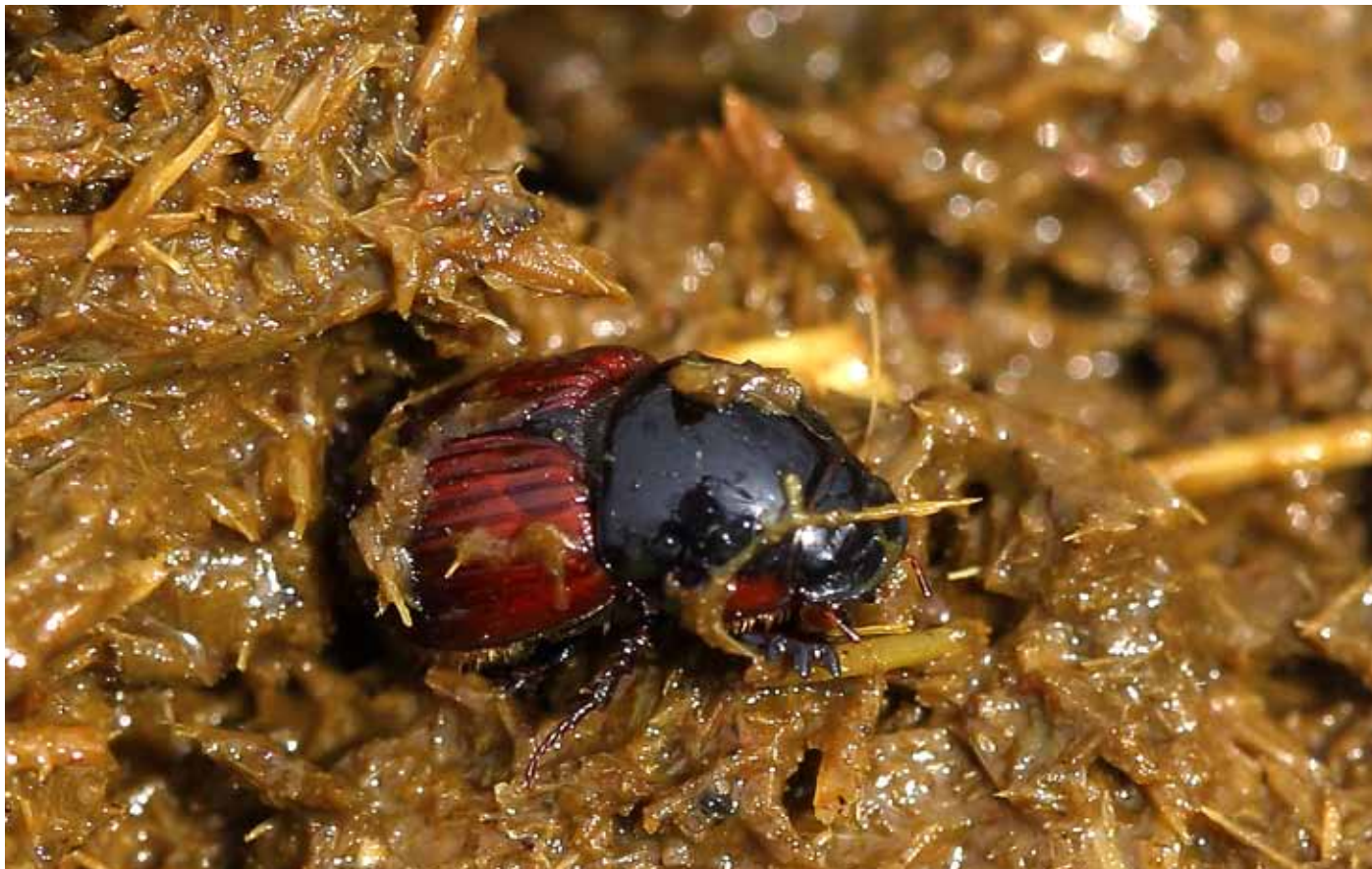
Den smukke rødbuget møgbille i hjemlige omgivelser.

Heldigvis kan man også nøjes med at gå på jagt efter spændende arter ovenpå selve kokassen. Ved Stubbe Sø kan man bl.a. opleve den sjældne og rødlistede stor gødningsrovflue, som ofte bruger tørre kokasser som base i sin jagt på de mange fluer, der altid er at finde, når der er kreaturer og deres efterladenskaber i farvandet. God jagt!