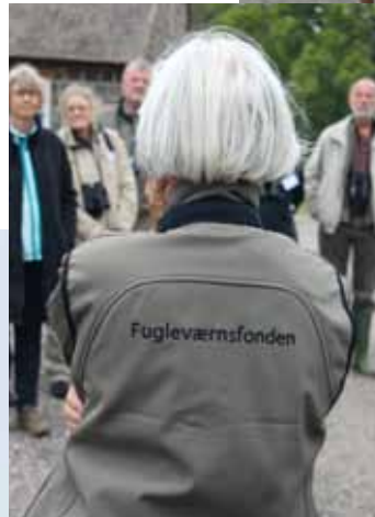
Nye veste til de frivillige doneret af VELUX Fonden