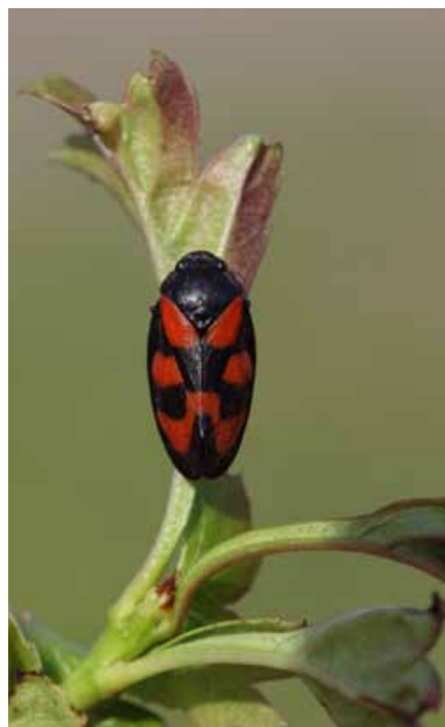
Cikaden Cercopis vulnerata