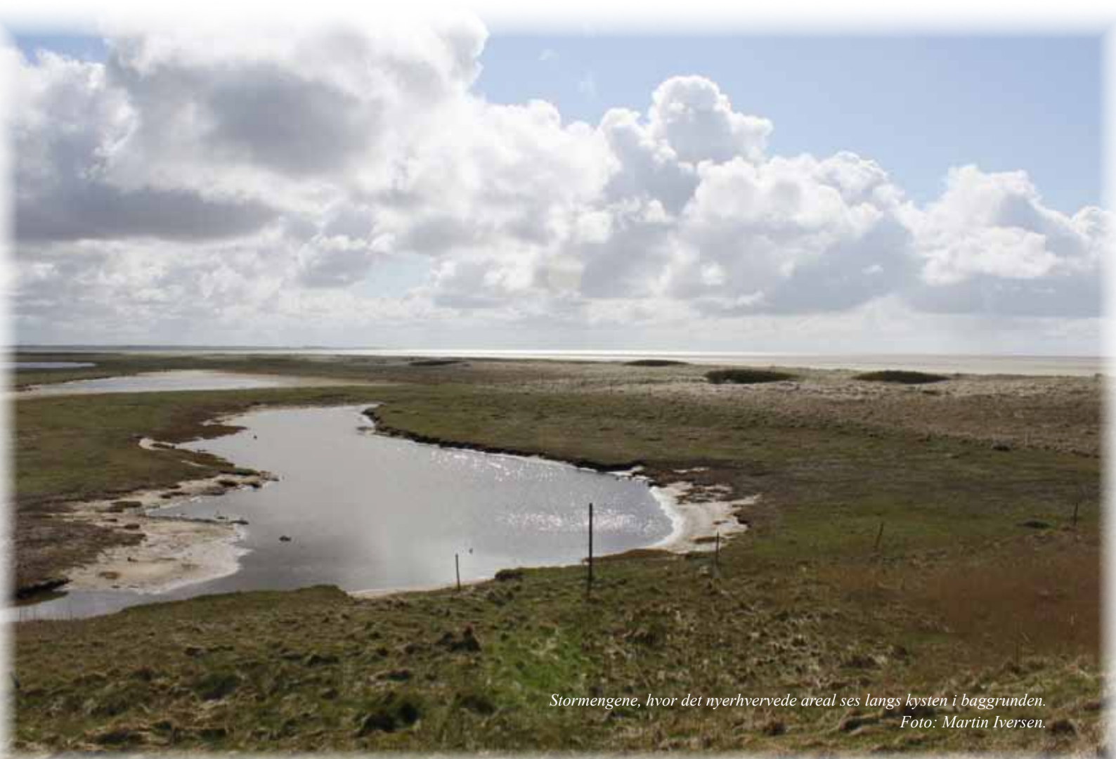
Stormengene, hvor det nyerhvervede areal ses langs kysten i baggrunden.

Stormengene repræsenterer på mange måder en unik natur med sin oprindelighed og overgang mellem forskellige naturtyper fra vade over sandmarsk til klithede. Disse naturtyper indeholder sjældne, værdifulde og bevaringsværdige plantearter, som tilfører området stor naturmæssig værdi. Derudover er Stormengene også en værdifuld fuglelokalitet. Eksempelvis er reservatet et meget værdifuldt rasteområde for mørkbuget knortegås samt flere arter af vadefugle, først og fremmest almindelig ryle som kan forekomme i meget store antal i og ved reservatet og også stor regnspøve, strandskade, klyde og stor præstekrave.