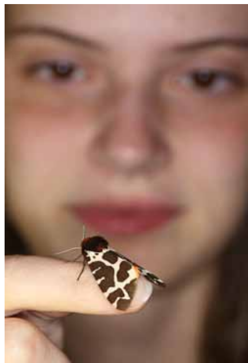
Den smukke bjørnespinder

BioBlitzene er ikke tænkt som en fest for naturnørder, men som en ny og spændende måde at formidle naturens mangfoldighed til alle interesserede. I 2015 rykker BioBlitzen til Fugleværnsfondens reservater på Fyn og Langeland: Bøjden Nor, Tryggelev Nor og Gulstav Mose. Datoerne er endnu ikke fastlagt, men hold øje med vores hjemmeside og facebookside, hvor datoerne offentliggøres i starten af det nye år. Kom og lær en masse om den spændende natur i Fugleværnsfondens reservater. Vi ses i felten!