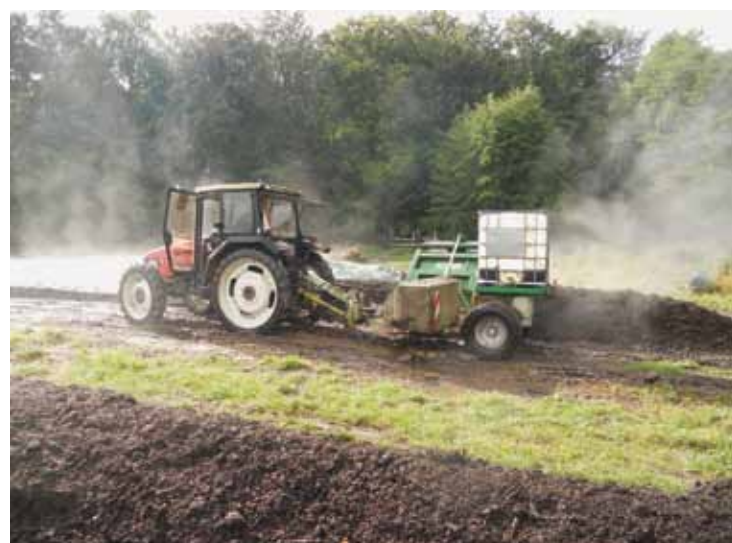
Kompostmilerne vendes flere gang om dagen for at fremme nedbrydningen, og forhindre milen i at blive alt for varm.

Projektet er støttet af Fonden for Økologisk Landbrug (FØL), og de ventende resultater vil foreligge ved udgangen af 2015 på deres hjemmeside under 'Projekt Kompost'.